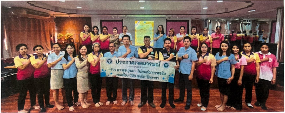
ภาพประกอบกิจกรรมการประกาศเจตนารมณ์ผู้บริหาร สำนักงานสาธารณสุขอำเภอตาลสุม วันพุธ ที่ ๑๓ มีนาคม พ.ศ. ๒๕๖๗